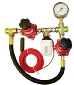
Control Automático (No Eléctrico) de Temperatura